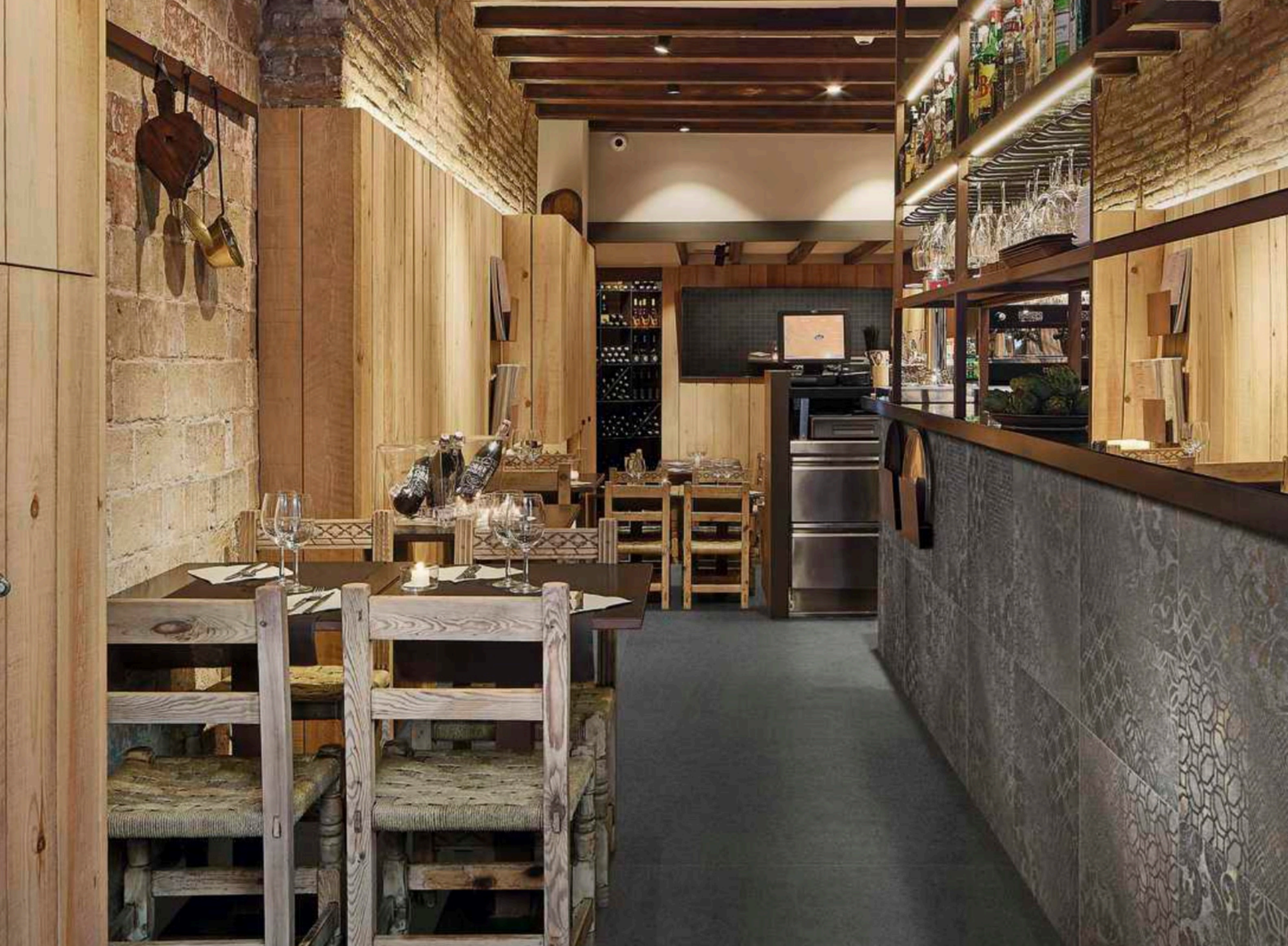
Basalto Lava 90 × 180