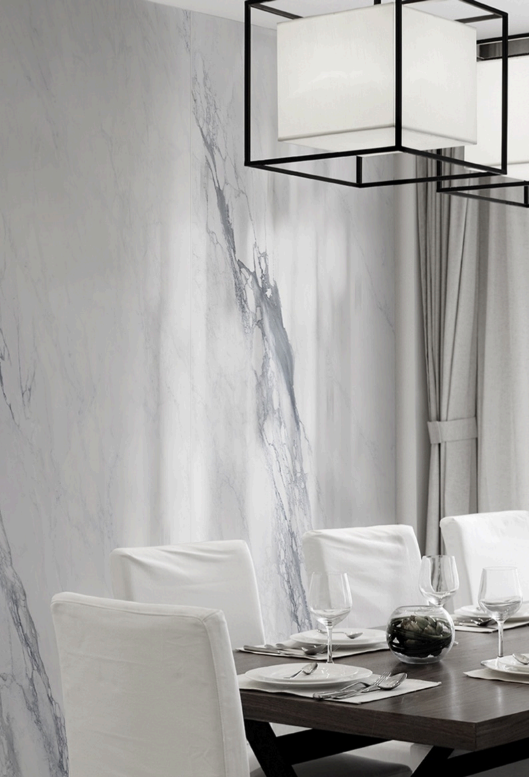
Bernini Glossy 120 × 120