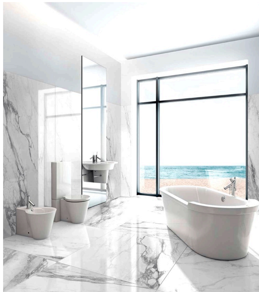
Bernini Glossy 120 × 120