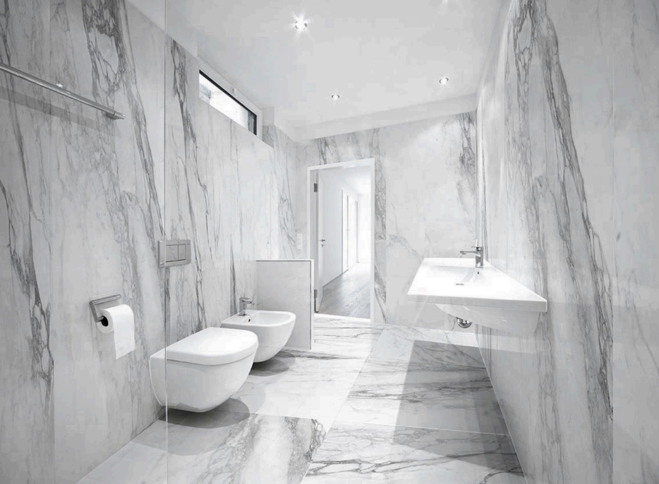
Bernini Glossy 120 × 120