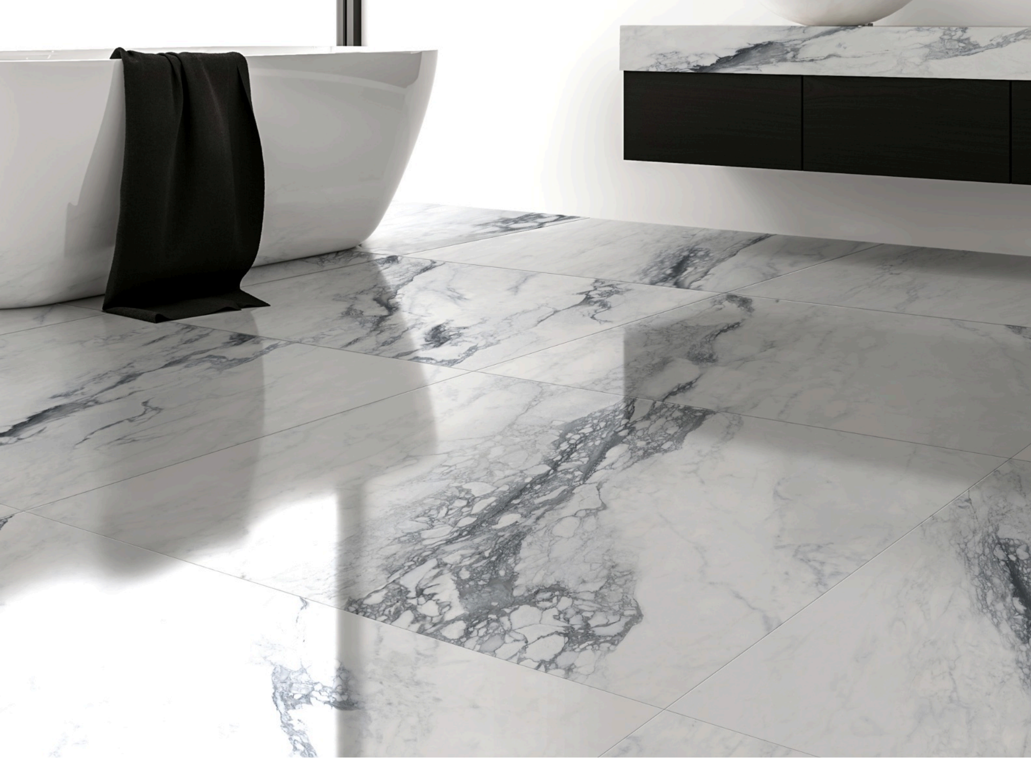
Bernini Glossy 120 × 120