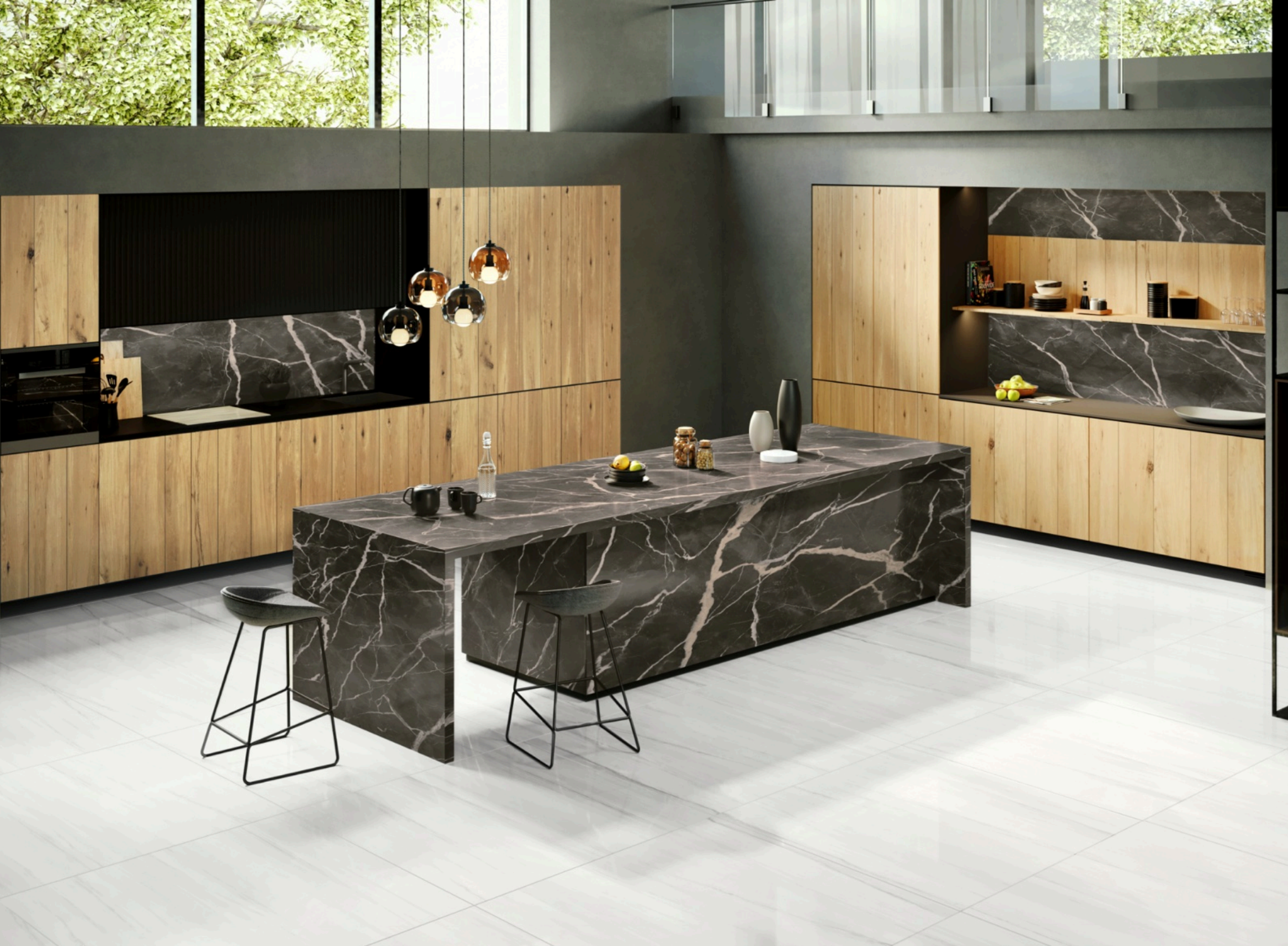
Dolomite Glossy 120 × 120