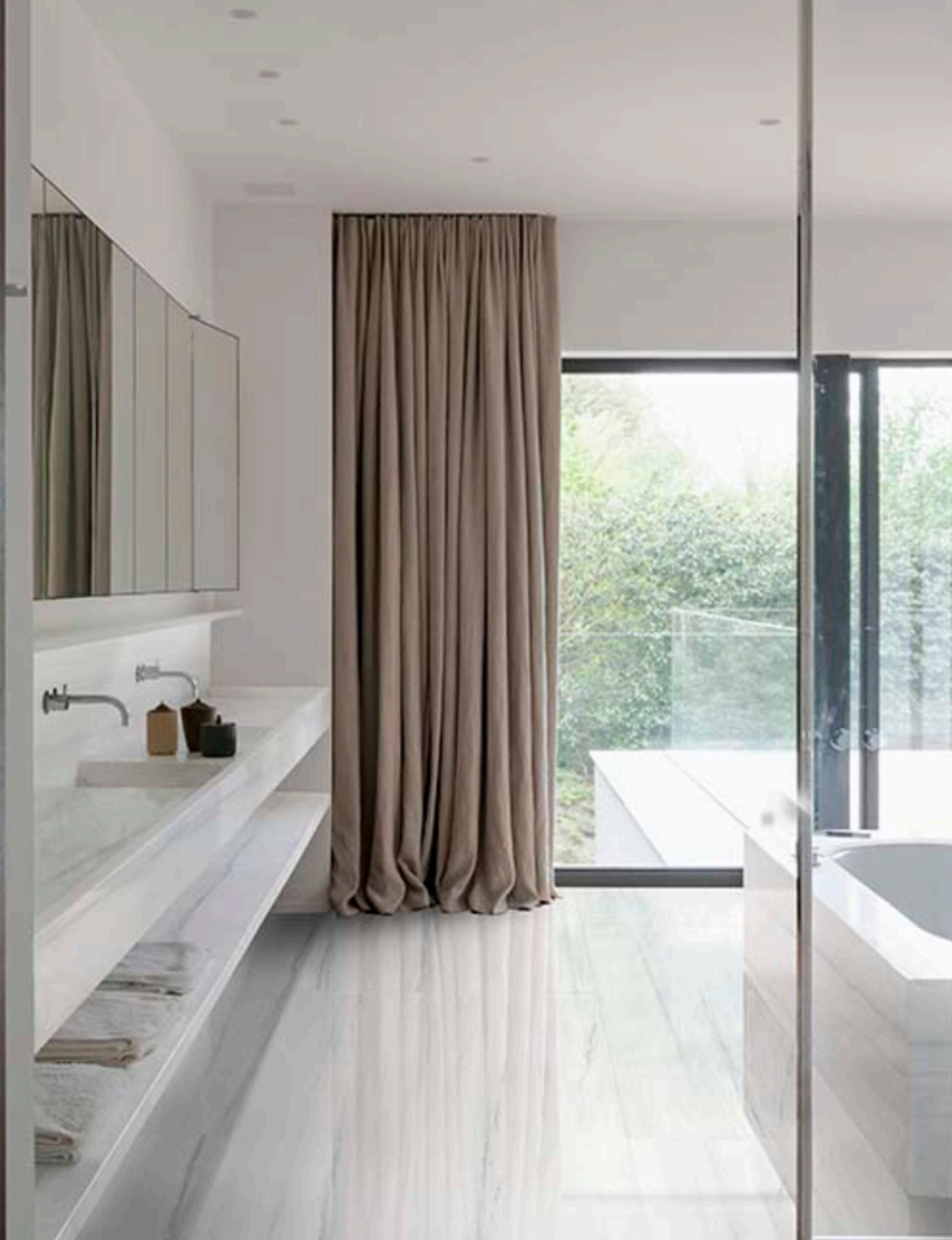
Dolomite Glossy 120 × 120