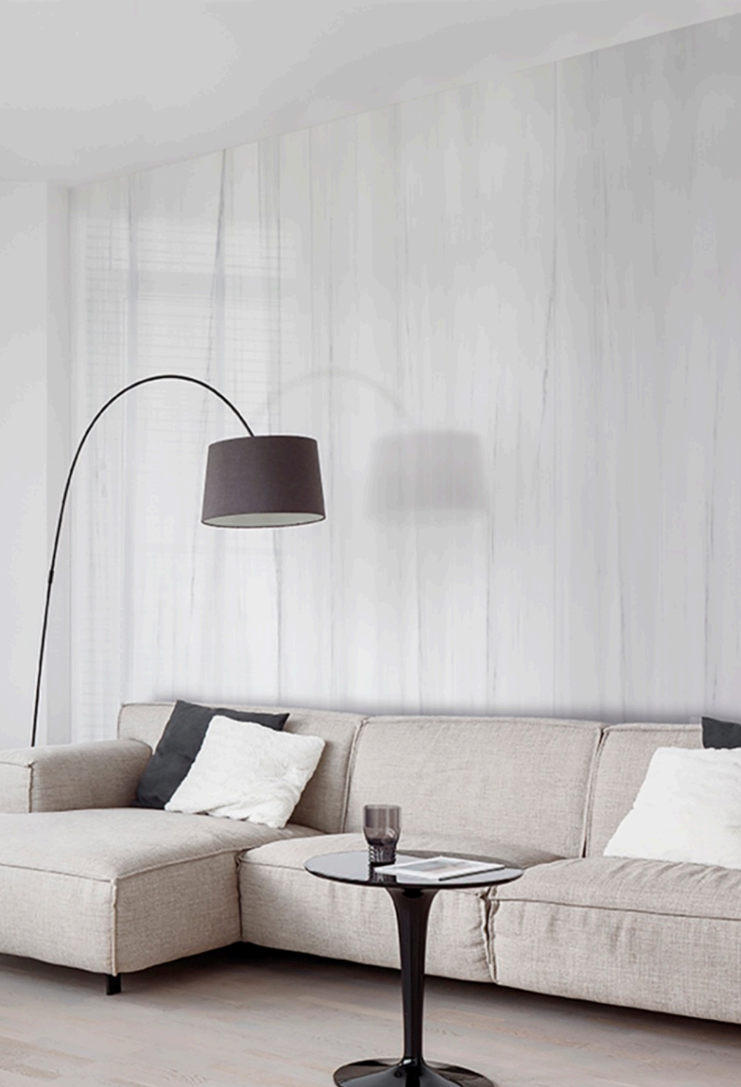
Dolomite Glossy 120 × 120