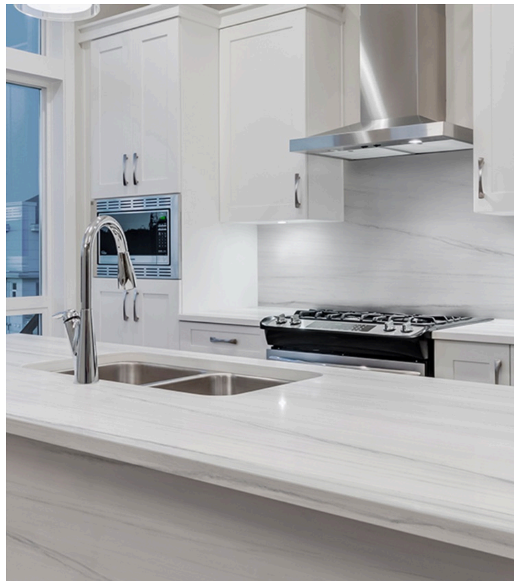
Dolomite Glossy 120 × 120