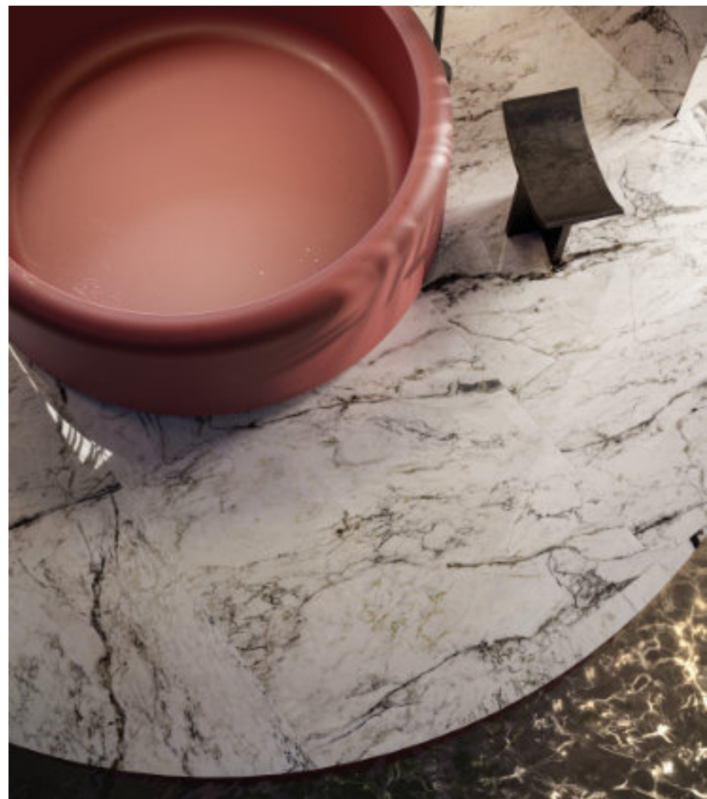
Dream Pure Breccia Capraia 120 × 120