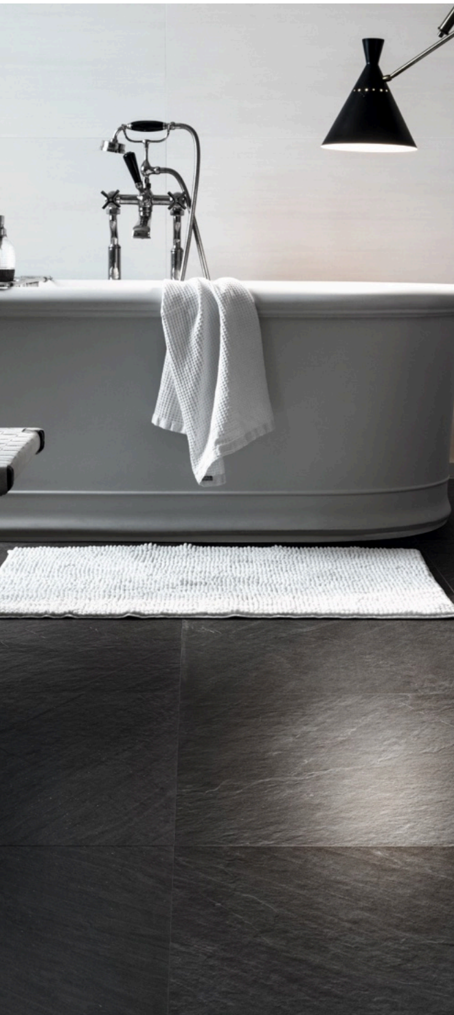
Lavagna Nero 75 × 150