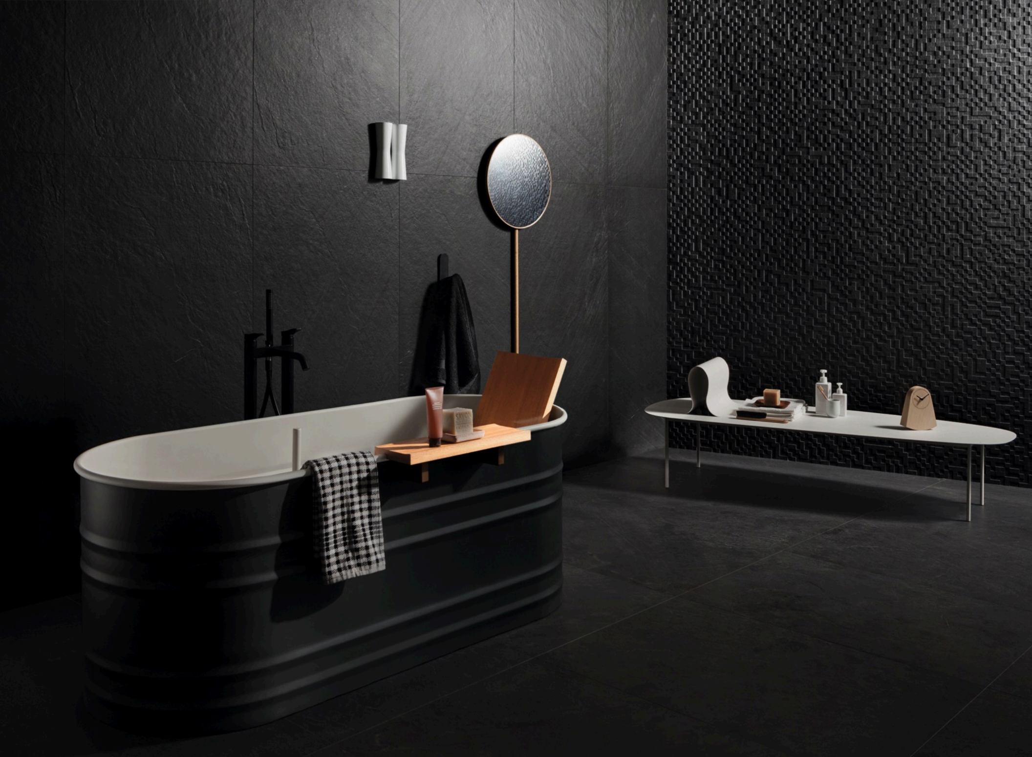
Lavagna Nero 75 × 150