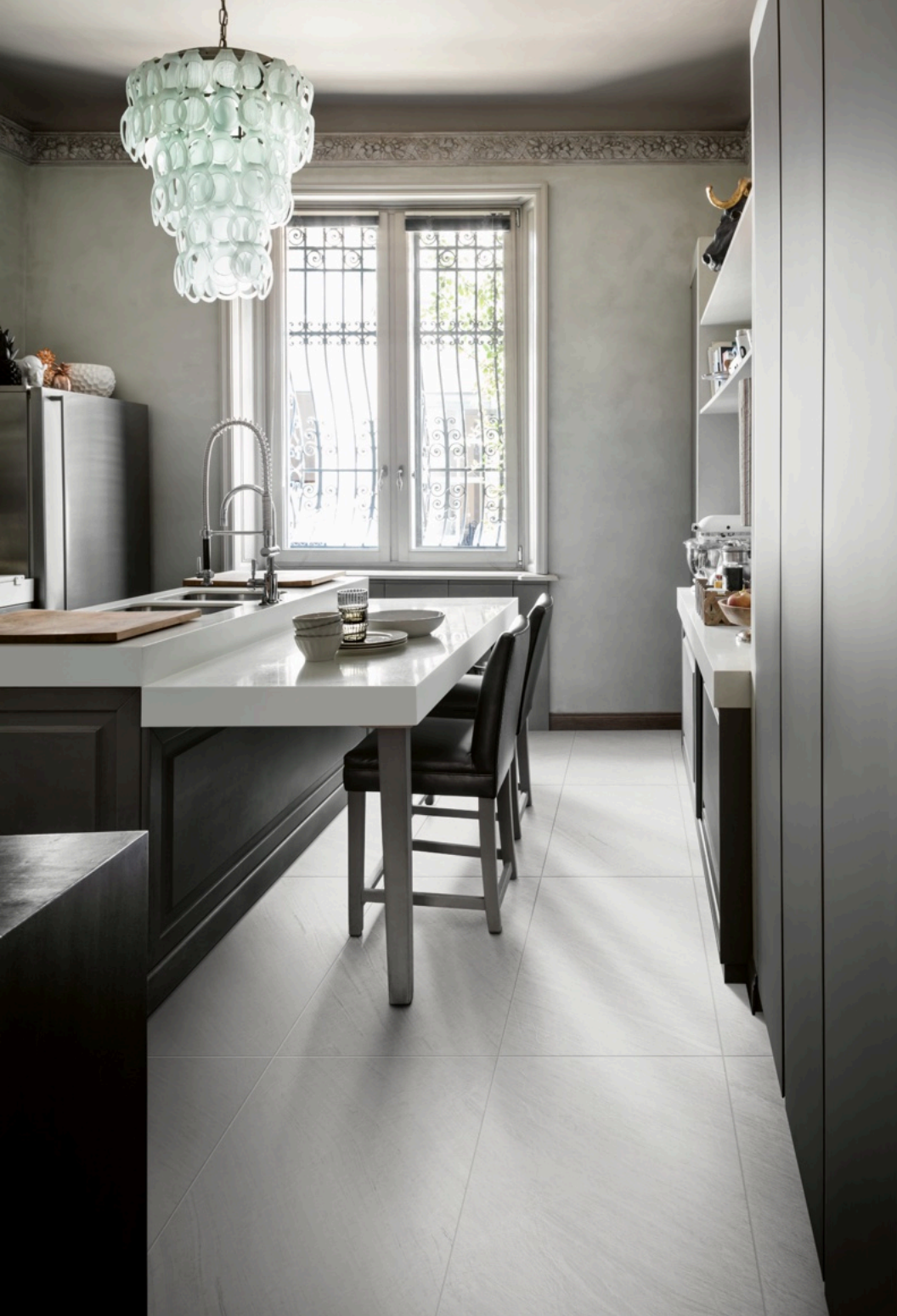
Lavagna Bianco 75 × 150