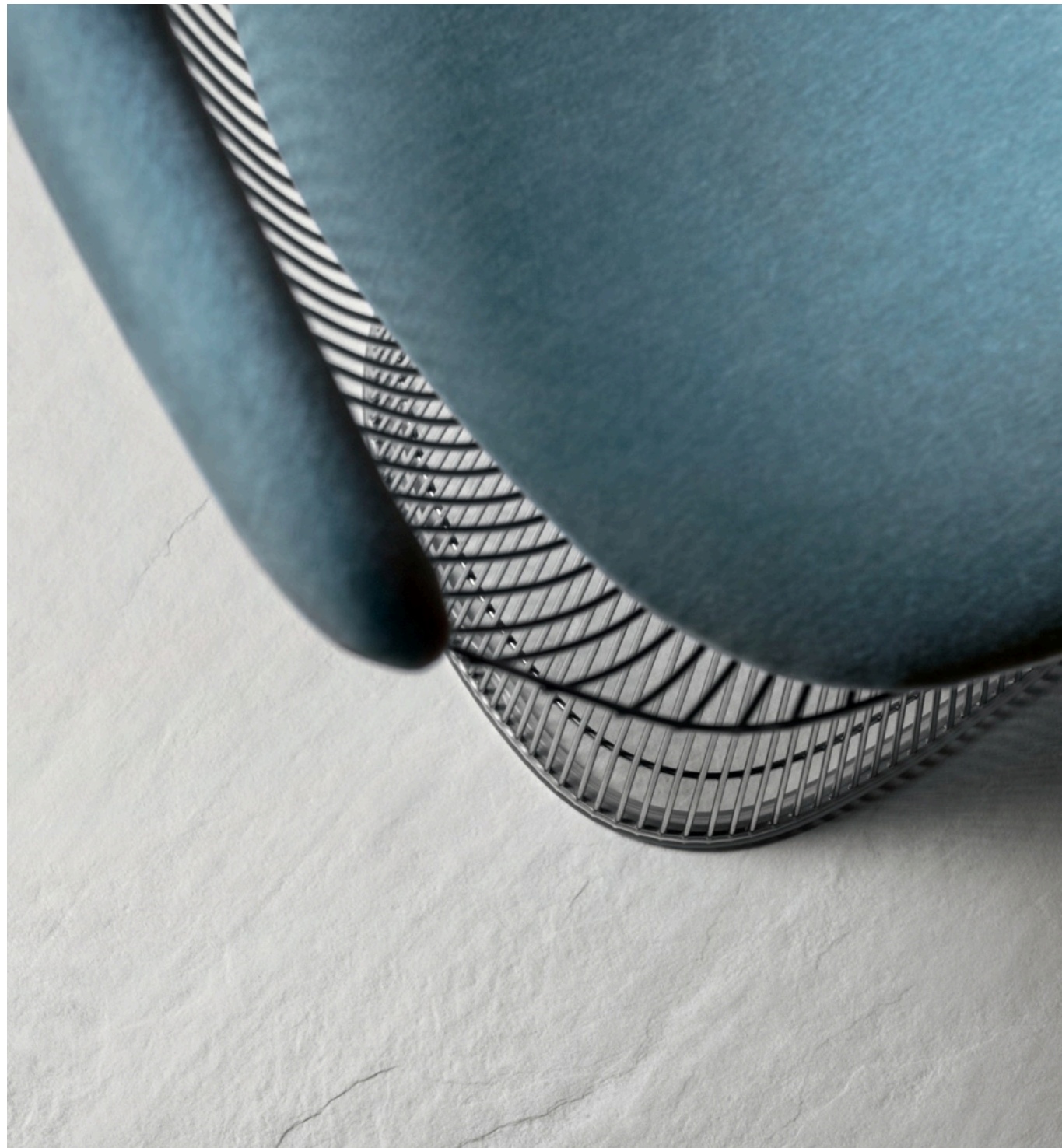
Lavagna Bianco 75 × 150