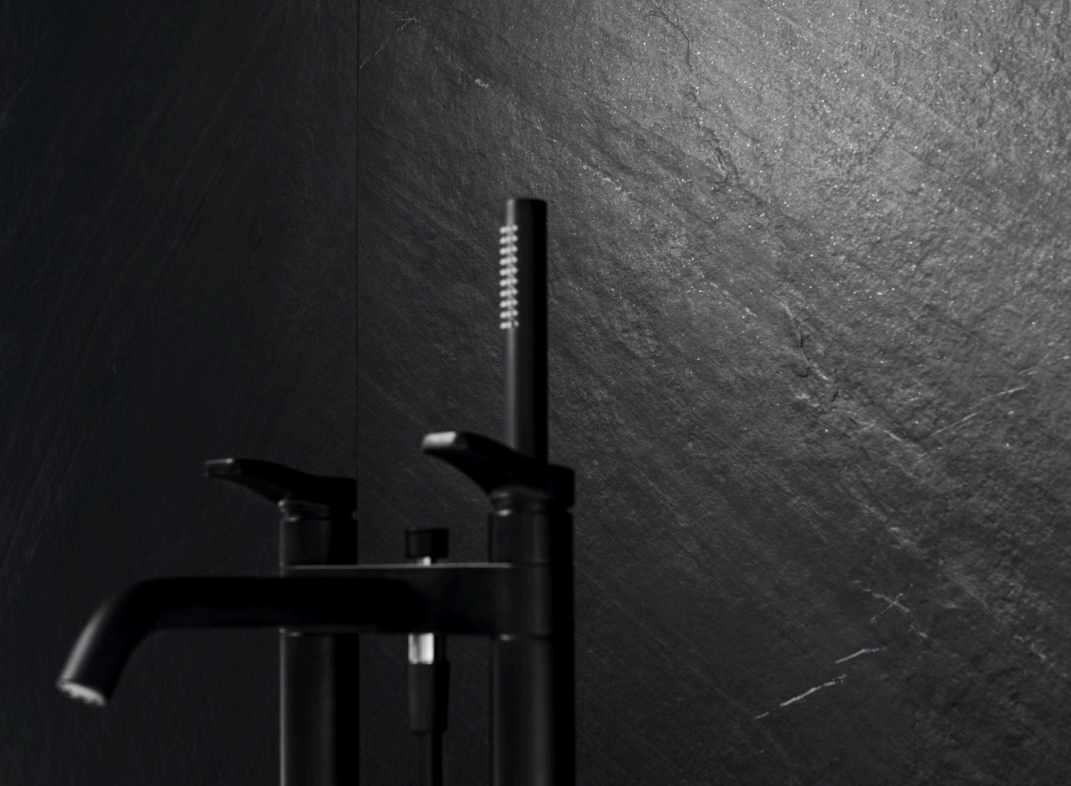
Lavagna Nero 75 × x150