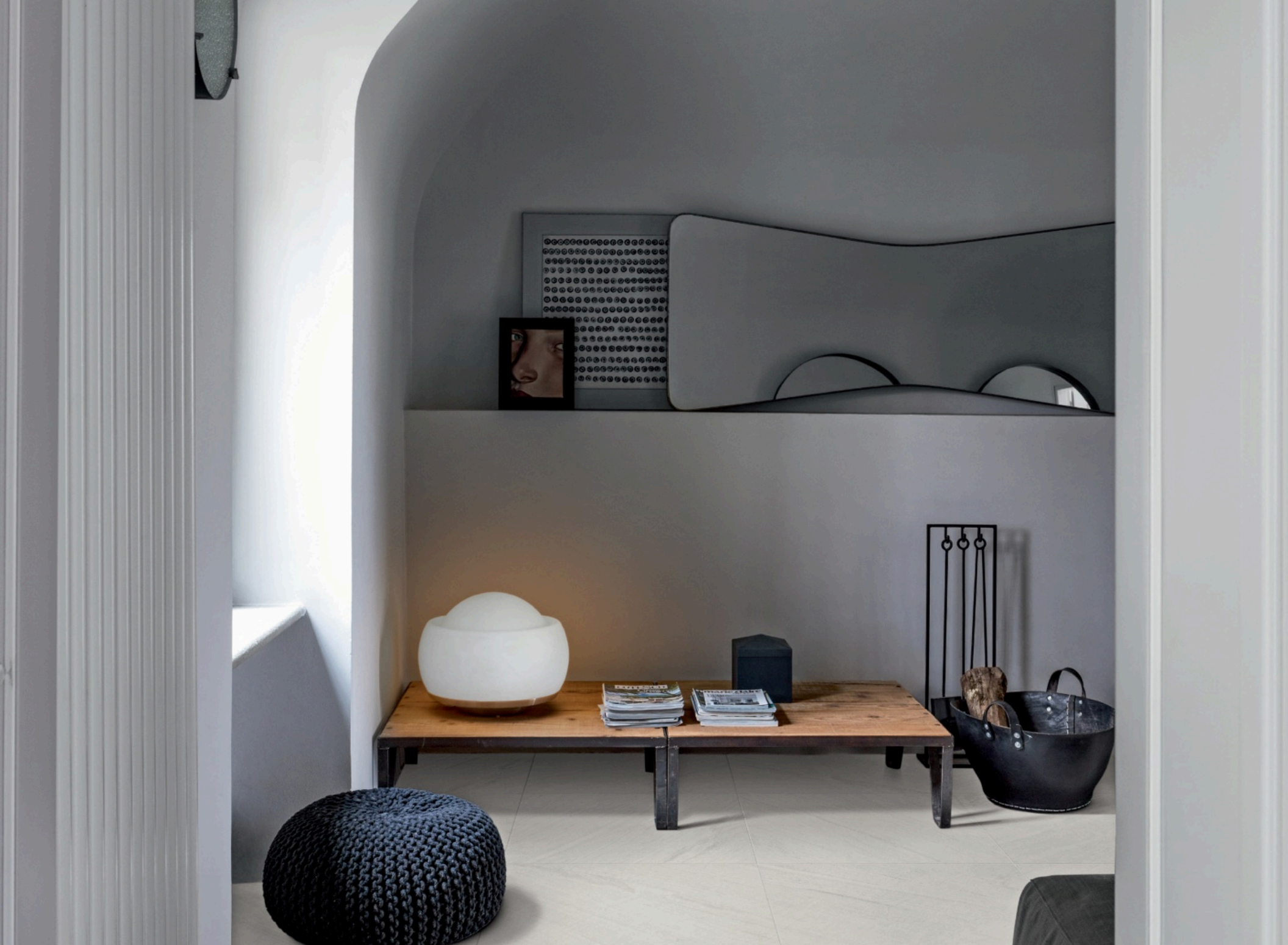
Lavagna Bianco 75 × 150