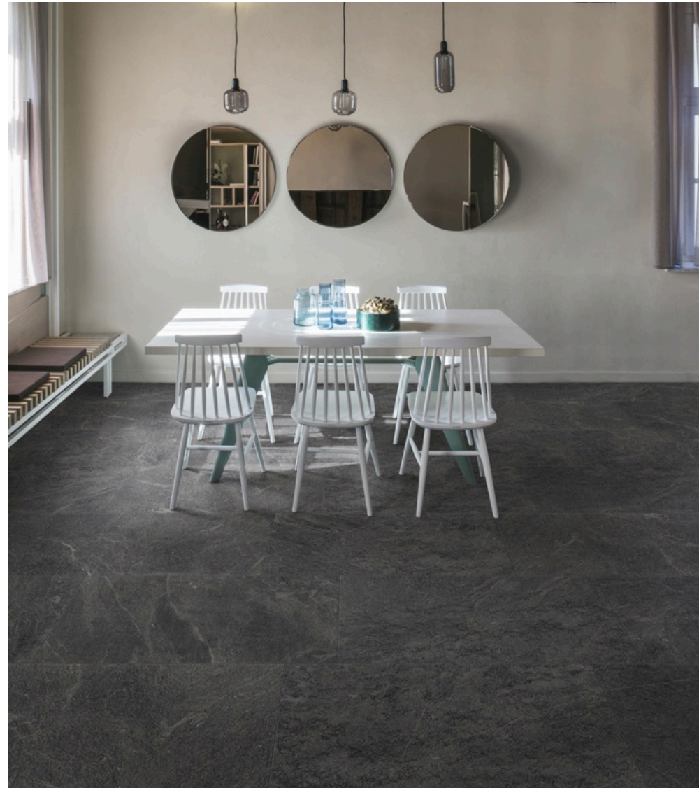
Quarzite Black 60 × 120