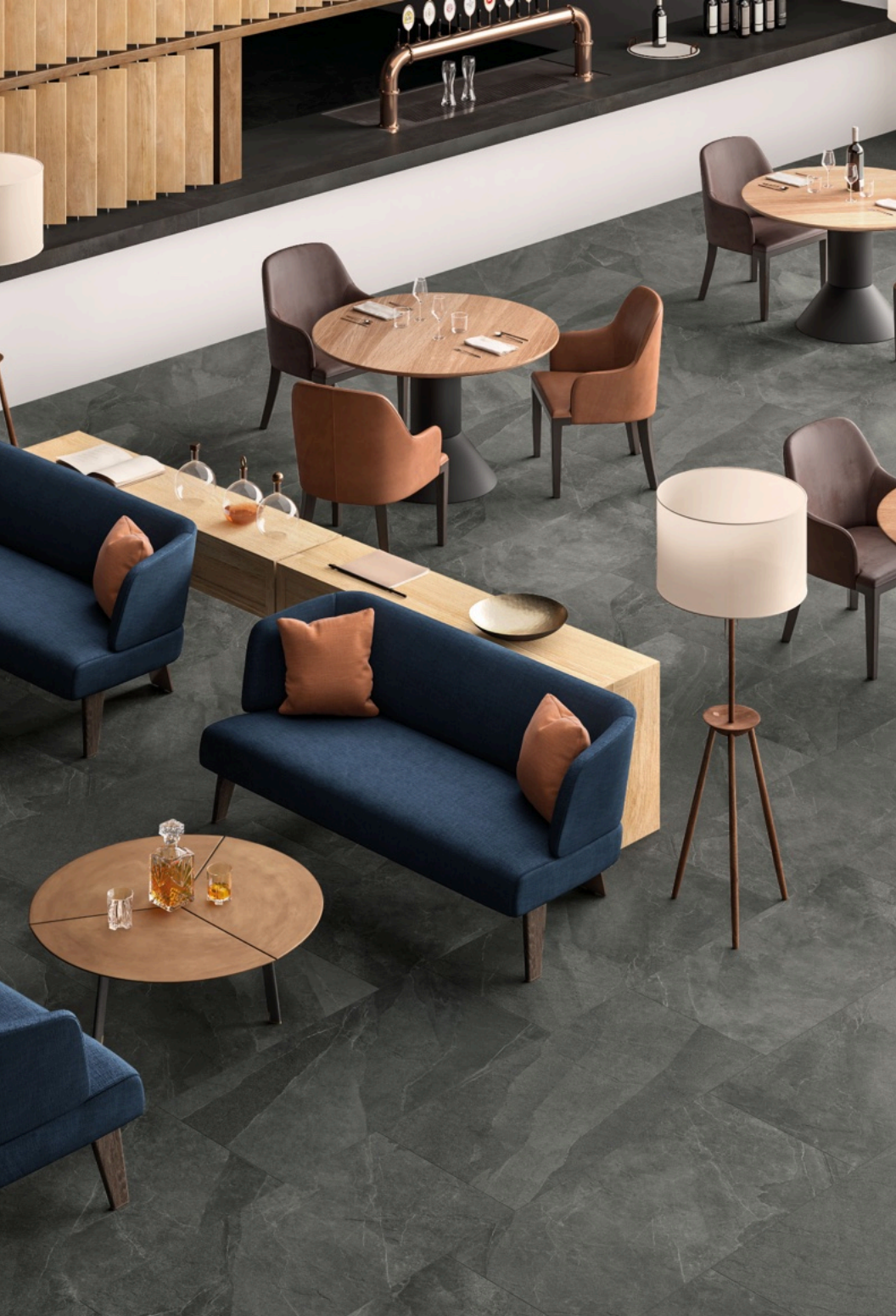
Shale Ash 80 × 160