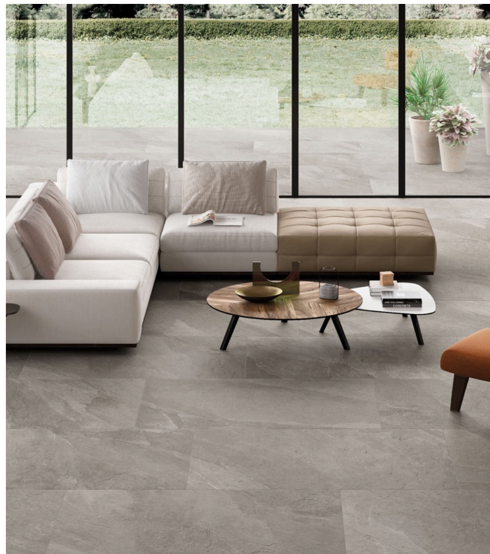
Shale Greige 80 × 160