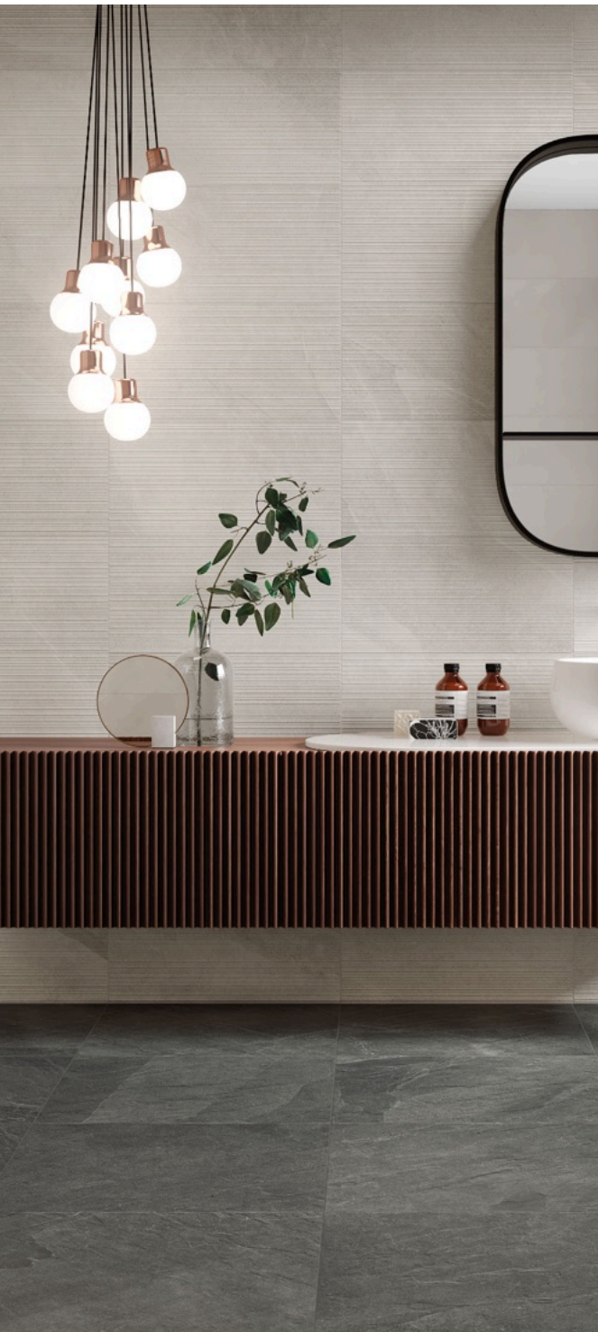
Shale Moon Ribbed 60 × 120 / Shale Ash 80 × 160