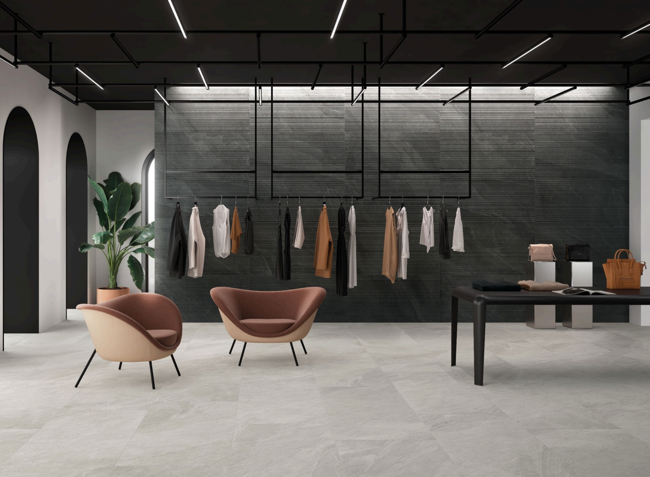
Shale Moon 80 × 160 / Shale Dark Ribbed 60 × 120