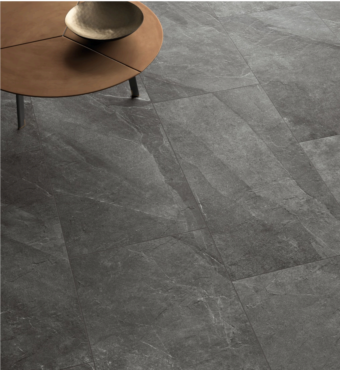
Shale Ash 80 × 160