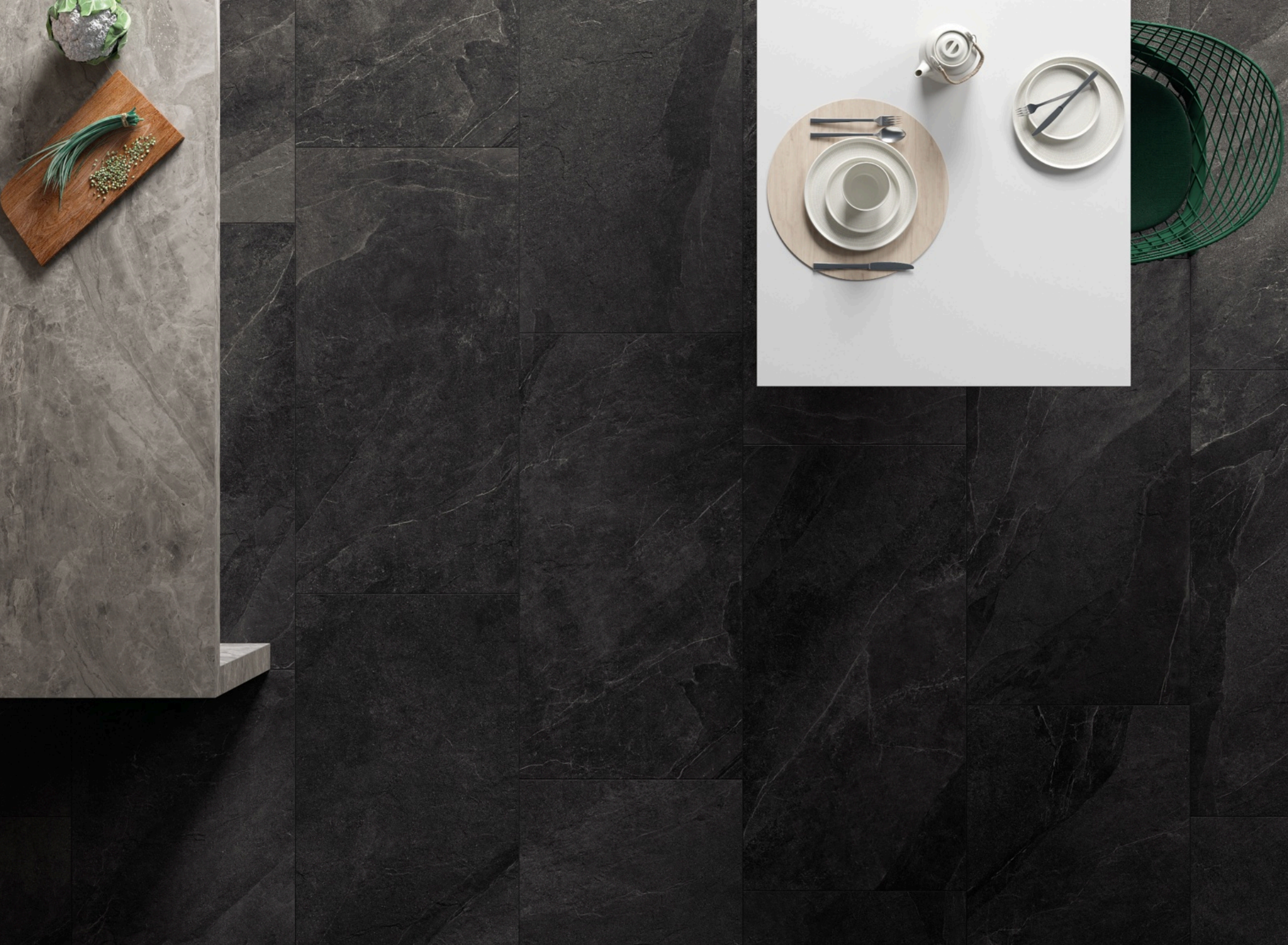
Shale Dark 80 × 160