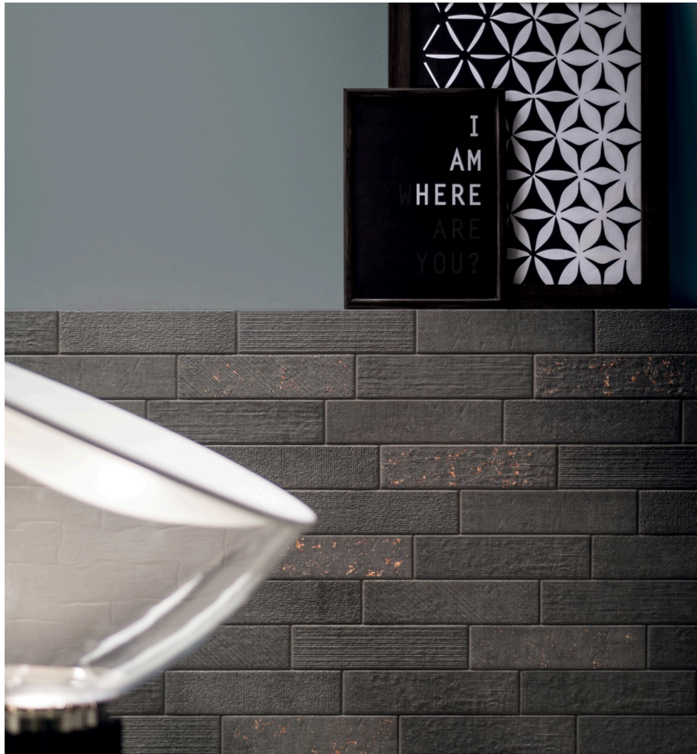
Textile Taupe 7.5 × 30