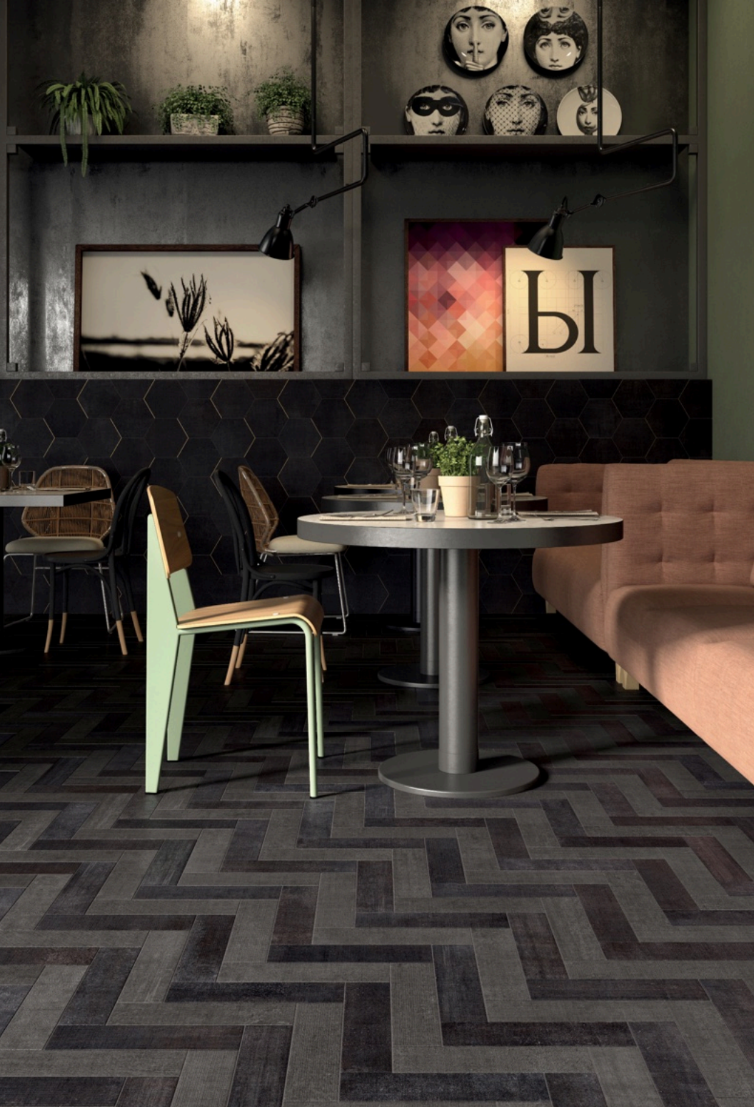
Textile Taupe 7.5 × 30 / Textile Dark 7.5 × 30