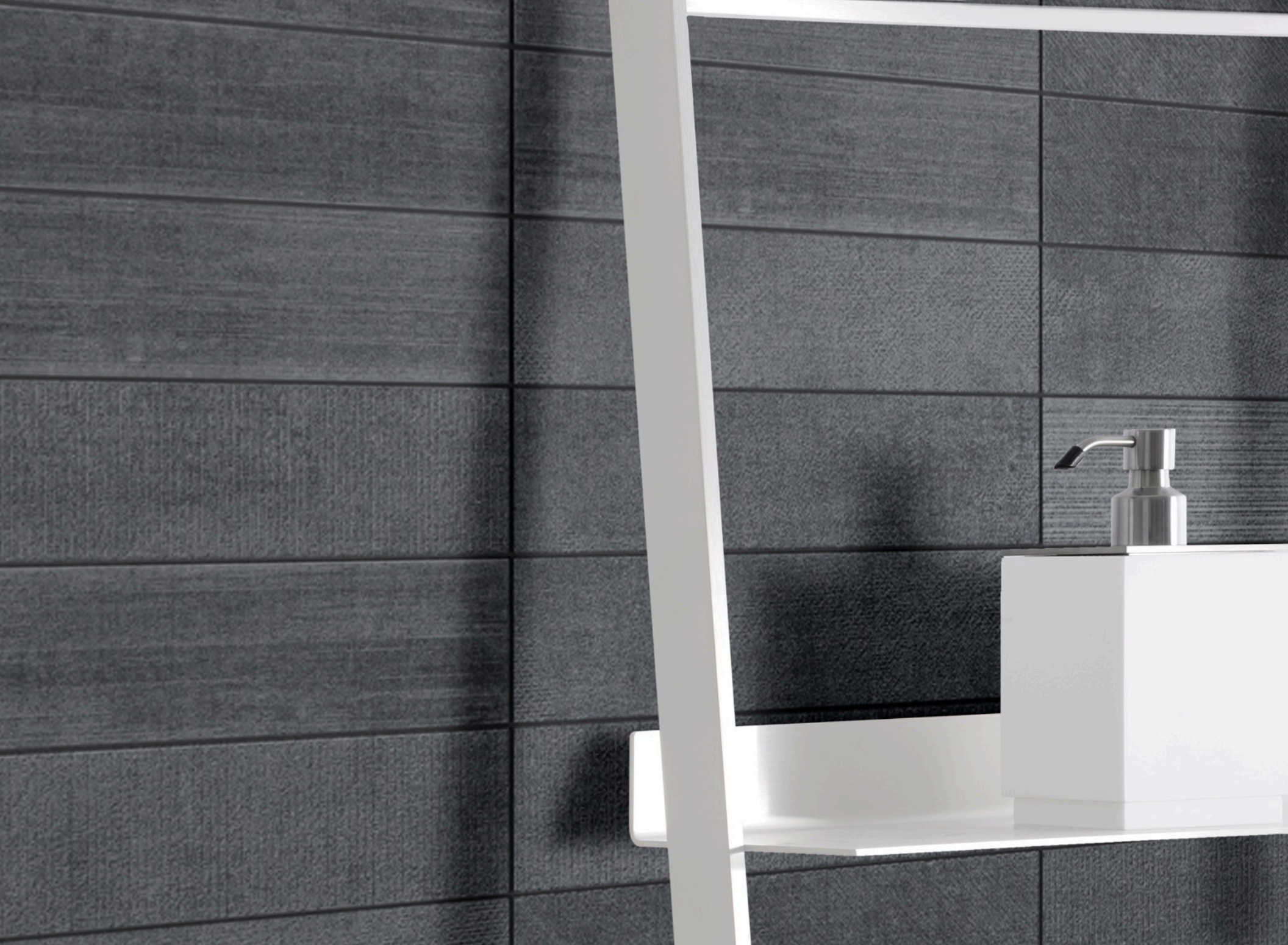
Textile Silver 7.5 × 30