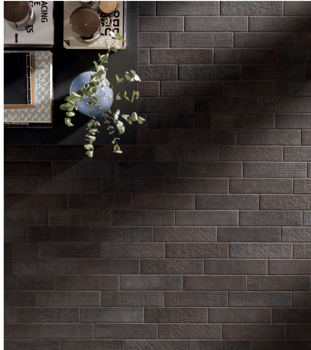
Textile Taupe 7.5 × 30 / Textile Dark 7.5 × 30