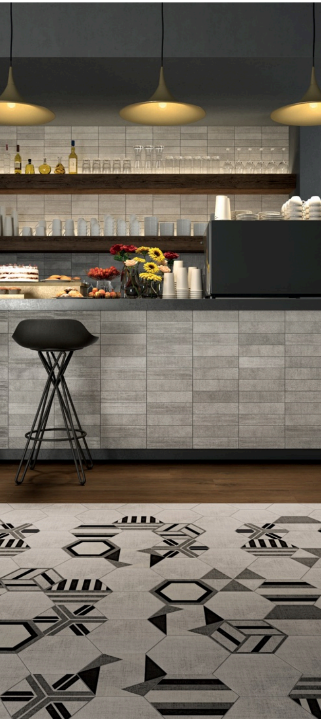
Textile Ivory 7.5 × 30