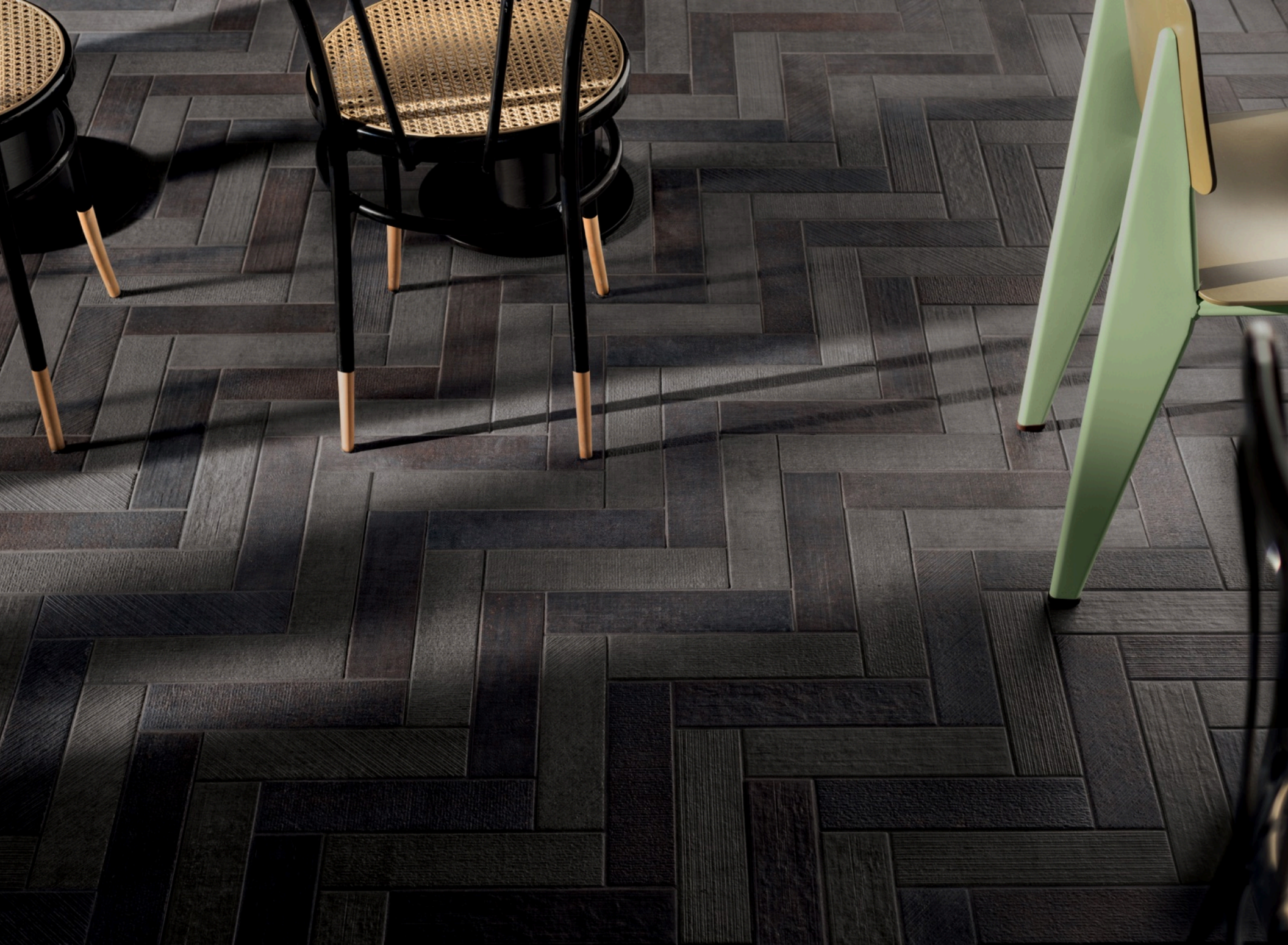
Textile Taupe 7.5 × 30 / Textile Dark 7.5 × 30