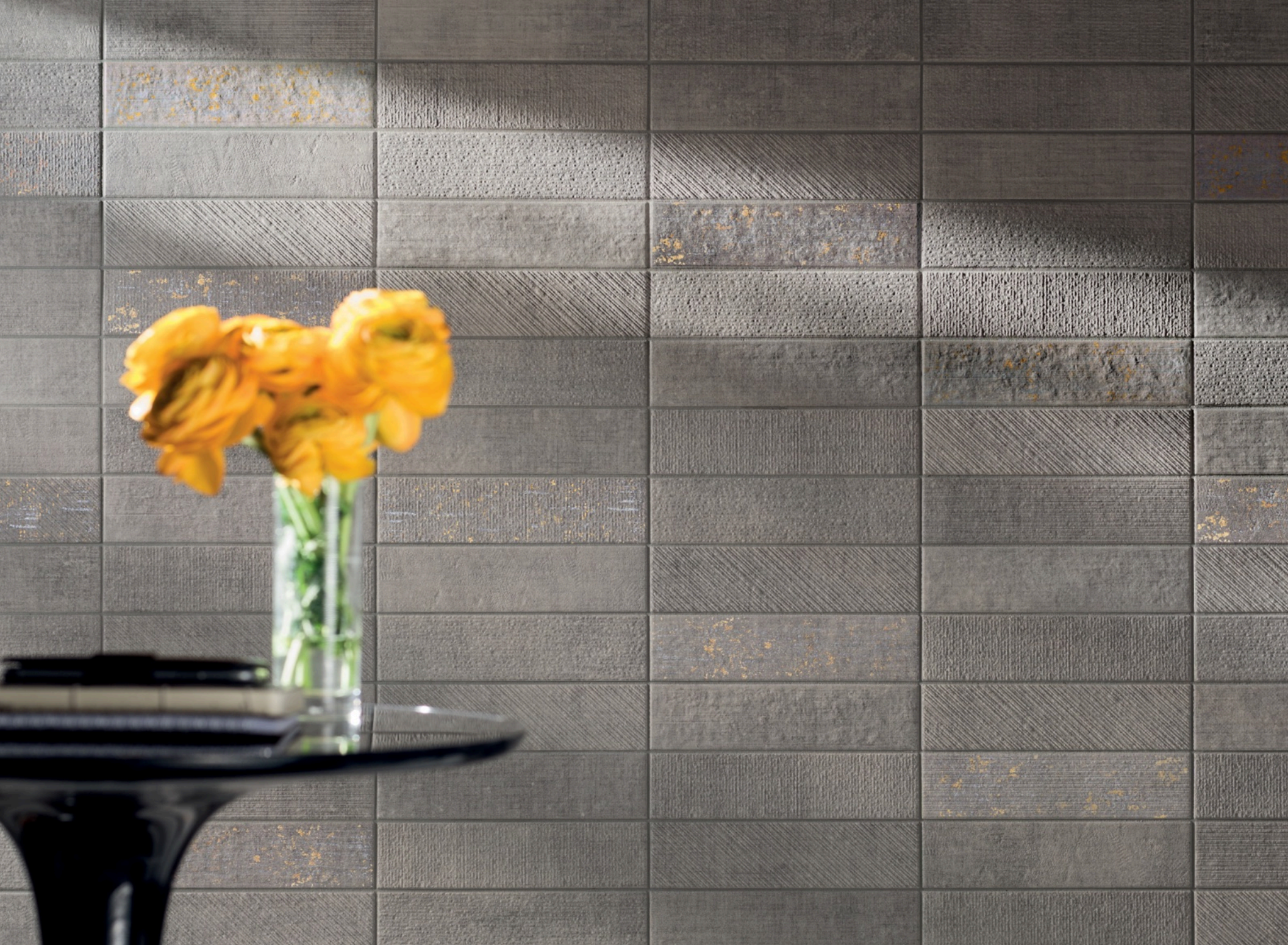
Textile Taupe 7.5 × 30