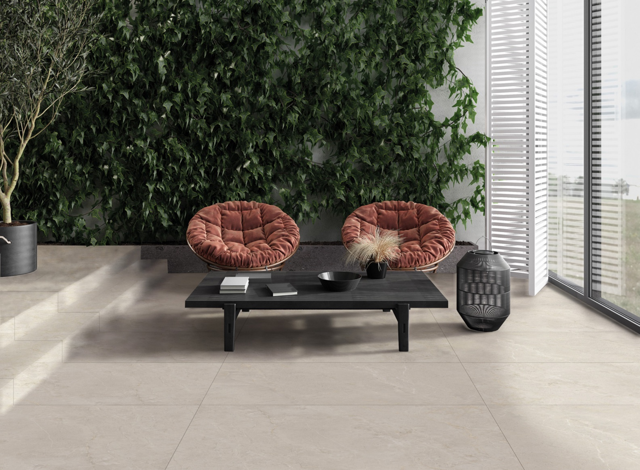
Wonder 160 Sleet 80 × 160