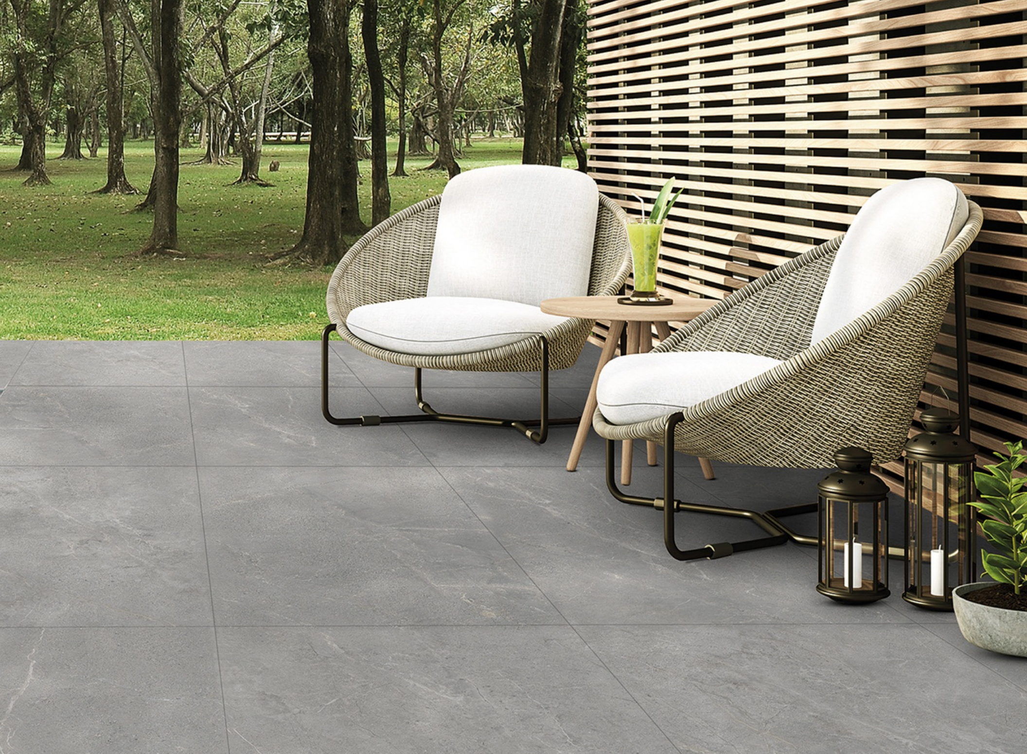
Wonder 160 Shade 80 × 160