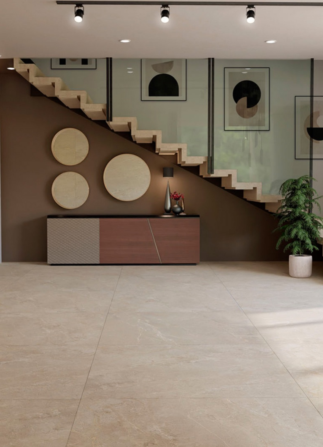
Wonder 160 Dunes 80 × 160