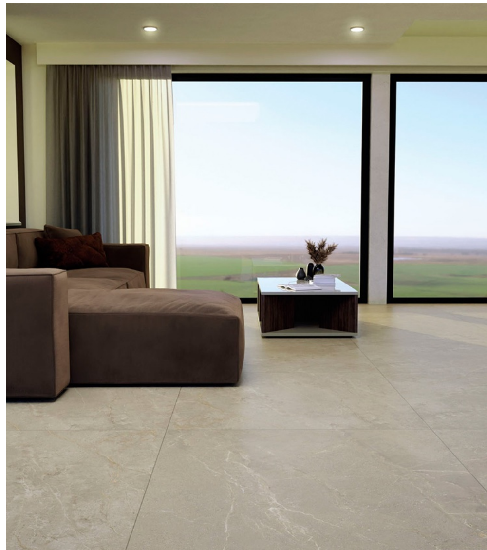
Wonder 160 Dunes 80 × 160